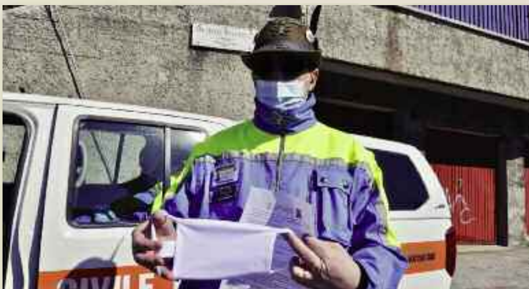
I volontari dell'Associazione nazionale alpini distribuiscono mascherine casa per casa a Trieste