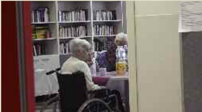
Anziani all'Itis di Trieste