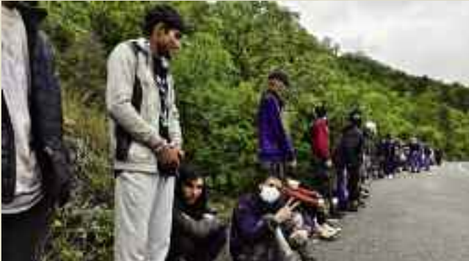
Migranti pachistani e afgiani intercettati dalla polizia alle porte di Trieste in arrivo dal confine sloveno