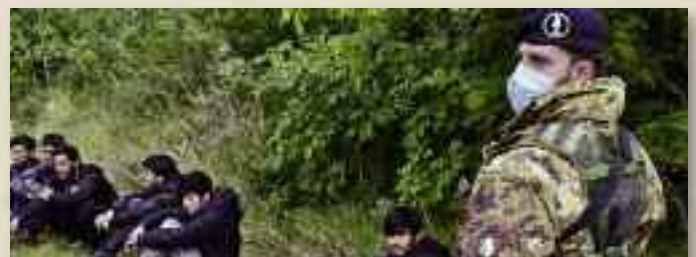
I militari di Strade Sicure del Piemonte Cavalleria hanno rintracciato i migranti afgiani arrivati dalla rotta balcanica alle porte di Trieste

Il 12 maggio sono arrivati in 160 in poche ore, in gran parte afgiani e pachistani, il picco giornaliero dall'inizio dell'anno. La riapertura della rotta balcanica sul fronte del Nord Est è iniziata a fine aprile, in vista della fase 2 dell'emergenza virus. A Trieste sono stati rintracciati una media di 40 migranti al giorno. In Bo-