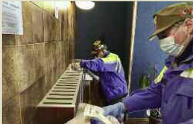
Volontari dell'Associazione Nazionale Alpini distribuiscono nella buca delle lettere le mascherine per la popolazione

di blocco per controllare il rispetto delle restrizioni sulle uscite di casa. I volontari dell'Associazione nazionale alpini con i giubbotti