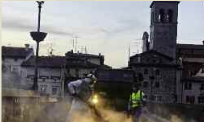
Il 3° Reggimento Alpini sanifica il ponte del Diavolo a Cividale del Friuli con la Protezione civile