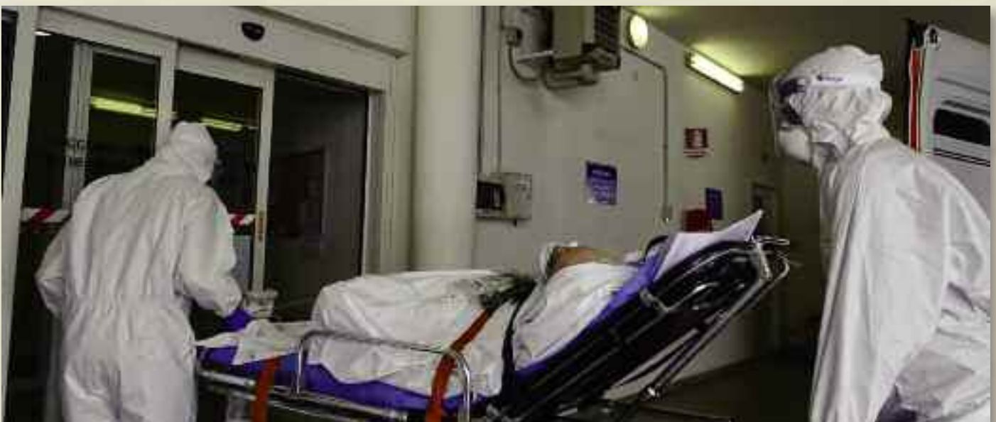
Paziente Covid trasportato dall'ambulanza del 118