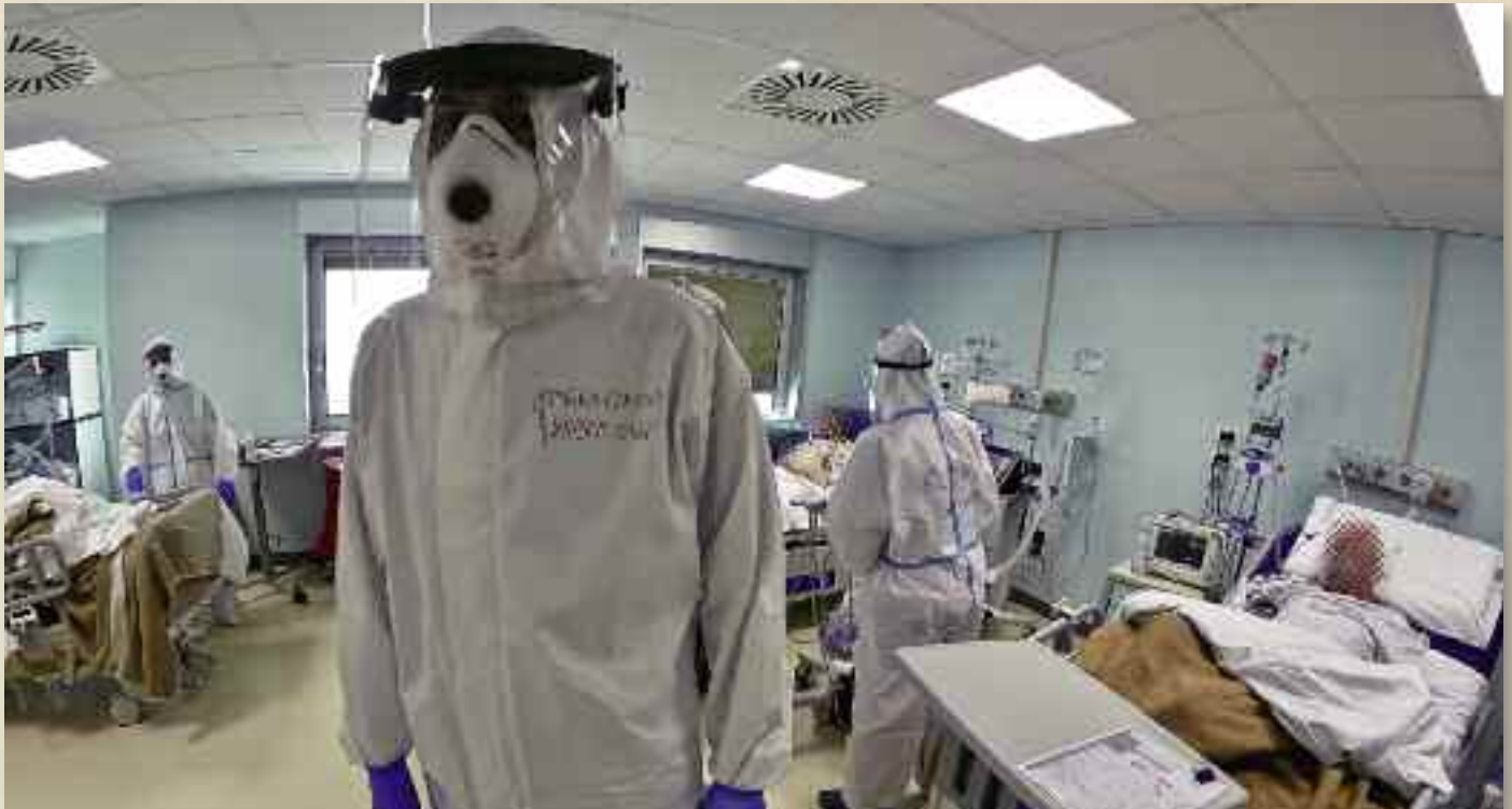
Ospedale di Cattinara a Trieste pneumologia terapia intensiva respiratoria pazienti Covid