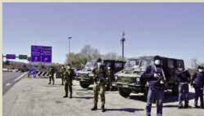
Polizia e militari del Piemonte Cavalleria presidiano il confine con la Slovenia

"Abbiamo registrato un crollo degli arrivi in marzo e per gran parte di aprile. Poi un'impennata alla fine dello scorso mese fino a metà maggio. L'impressione è che per i paesi della rotta balcanica nello stesso periodo sia avvenuta la fine del lockdown migratorio. In pratica hanno aperto i rubinetti per scaricare il peso dei flussi sull'Italia e sul Friuli-Venezia Giulia in particolare creando una situazione ingestibile anche dal punto di vista sanitario. È inaccettabile"