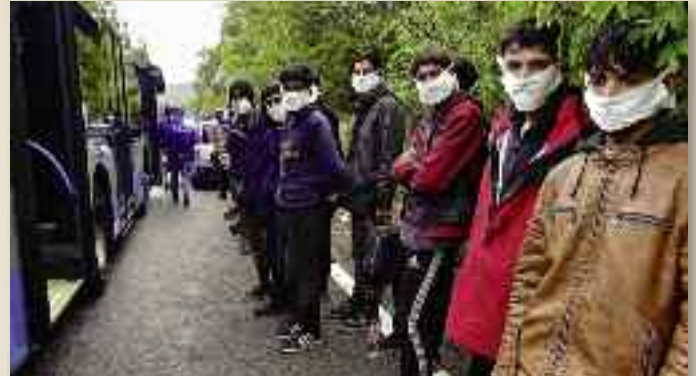
La polizia ha distribuito le mascherine ai migranti intercettati a Trieste

snia sarebbero in 7500 pronti a partire verso l'Italia.