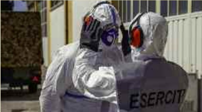
Personale dell'esercito si prepara alla sanificazione