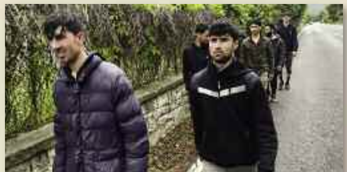
Migranti afgiani hanno appena passato il confine sloveno entrando in Italia

cina di afgiani, che abbiamo intercettato prima della polizia. Uno indossa una divisa mimetica probabilmente bosniaca, un altro ha un barbone e sguardo da talebano e la principale preoccupazione è "di non venire deportati" ovvero rimandati indietro. Non sanno che la Slovenia, causa virus, ha sospeso i respingimenti dall'Italia. Di nuovo in marcia i migranti tirano un sospiro di sollievo quando vedono un cartello stradale che indica Trieste. Il capetto alza la mano in segno di vittoria urlando da dove viene: "Afghanistan, Baghlan", una provincia a nord di Kabul.