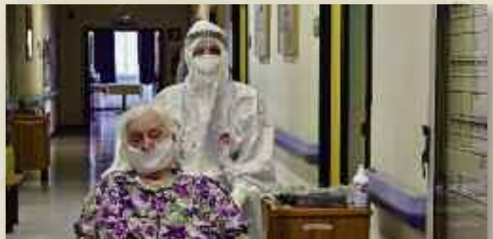
Bruna un'ospite della struttura per anziani Itis di Trieste