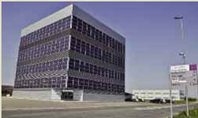
Il "cubo" centro operativo della Protezione civile a Palmanova

conferenza con sindaci, prefetti ed ospedali. "Siamo stati colpiti dal virus una settimana dopo le altre regioni del Nord, ma se non chiudevamo subito le scuole insistendo sulle misure restrittive, anche in assenza di contagio, sarebbe stato un disastro" spiega Riccardi che viene sottoposto come lo staff a controlli continui per evitare l'infezione nel quartier generale.