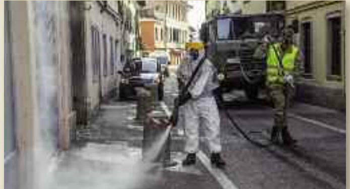
3° Rgt. Art. da Montagna Emergenza Covid Civile del Friuli

mento di Strade sicure. A Trieste il prefetto ha chiesto e ottenuto 115 dragoni di rinforzo del reggimento Piemonte cavalleria schierato al fianco della polizia in città e lungo il confine con la Slovenia. "Tutte le forze armate sono impegnate in prima linea al fianco dei medici e degli infermieri, che combattono la guerra contro il virus" sottolinea il colonnello Giuseppe Russo, comandante del Piemonte cavalleria. La Difesa ha messo a disposizione una struttura militare alle porte del capoluogo giuliano per la quarantena. All'interno le stanze per i positivi senza sintomi sono confortevoli con la tv e in riva al mare. "Non vedevo l'ora dopo giorni in ospedale" confessa un contagiato appena portato in ambulanza, che cammina sulle sue gambe.